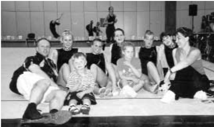
Gruppenbild mit Anhang

Am Montag, den 20.05. reisten wir mit zwei bis unters Dach beladene-