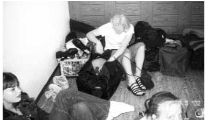
„Wohnen im Plattenbau“

Die Übung war nicht fehlerfrei, reichte aber für einen 11. Platz, so dass wir zusammen mit den Plätzen 5-12 ein