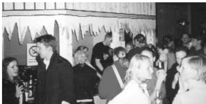
Reges Treiben an unserer Pisten-Bar