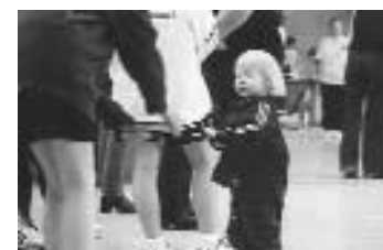
Früh übt sich: kleines Mädchen mit einem Schläger

Es war ein klasse Tag mit Euch, Jungs und Mädels. Wir sind stolz auf Euch und macht weiter so!