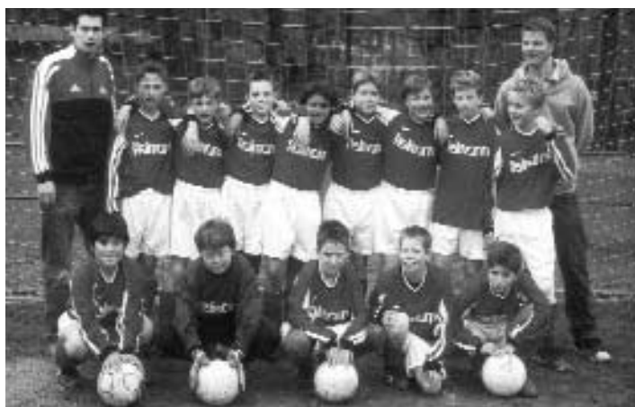
Die Spieler der D - Jugend