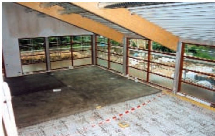
Blick vom 1. OG in das Studio