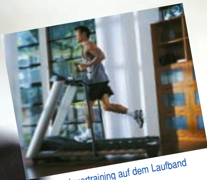
Ausdauertraining auf dem Laufband

Sportforum Eröffnung 1. September Schon 200 Mitglieder