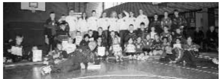
Unsere Ballschulkindern mit den Damen der 2. Bundesliga

Zum Abschluss des Turniers erhielt jeder Teilnehmer der Ballschule eine wunderschöne Urkunde. Diese wurden den Kindern von der