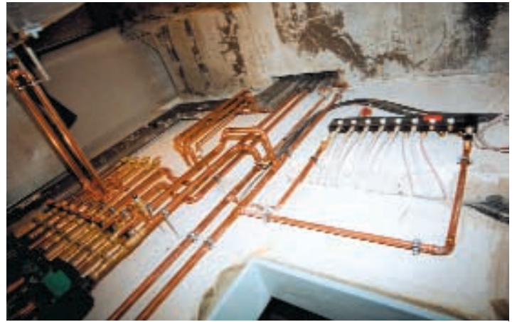
EG: „Klima-Raum“ - Verteiler Fußbodenheizung 1. OG

Atmosphärisches ist spürbar. Ausgezeichnete Lichtverhältnisse und eine Decken-Lärmdämmung werden dem Wohlbefinden der Studiogäste dienen. Gesamteindruck: