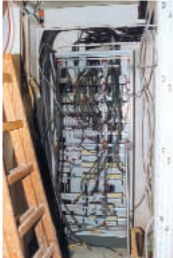
„Hier kommt alles zusammen“

Mit Fertigbauteilen und modernsten apparativen Hilfsmitteln lassen sich Neubauten in immer kürzerer Zeit erstellen.