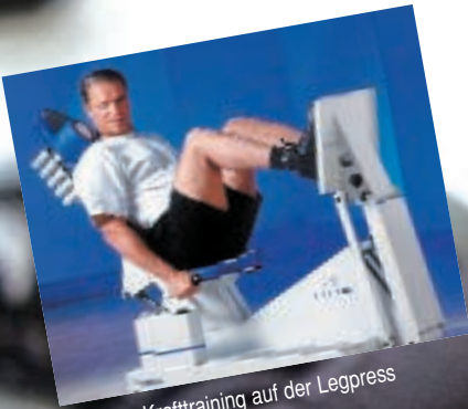
Krafttraining auf der Legpress