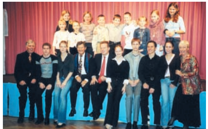
Unsere Tänzer nach der DTSA-Abnahme