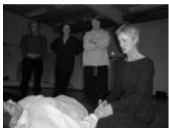
Eine wohltuende Handmassage

Das beliebte Wochenende erlaubt es, gemeinsam miteinander neue und bekannte Übungen auszuprobieren, die für den normalen Übungsalltag zu zeitintensiv sind. Hier finden wir die notwendige Ruhe, um uns auf eine Bewegung einzulassen und hinterher kurz Erfahrungen auszutauschen. Bei längerem, gemeinsamem Üben ist eine erstaunliche Energiesteigerung zu spüren, welche nicht nur die „Fortgeschrittenen“ bestätigen, sondern auch von „Anfängern“ erfahren wird.