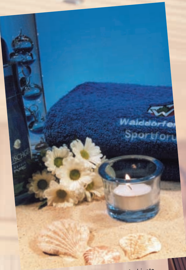
Relaxen in freundlichem Ambiente