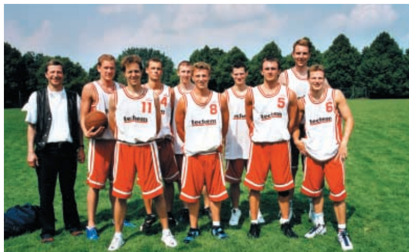
Unsere Herren aus der 2. Regionalliga

Männlein und Weiblein oder Opa und Enkel spielen sowieso ganz frei von sportlichem Ehrgeiz auch gern mal „Mixed“. Kurz: Ob Ballkindergarten oder Super-Senioren, Hobby-Mixed oder Regionalliga-Herren: Basketball im Walddorfer SV ist ein großer bunter Strauß, der für jede und jeden eine schöne „Korb-Blume“ bereithält. Oder um ein anderes schiefes Bild zu verwenden: Die Basketballer des Walddorfer SV sind erfolgreich und geben doch niemandem einen Korb – sie sind im Gegenteil häufig „paarweise“ aktiv.