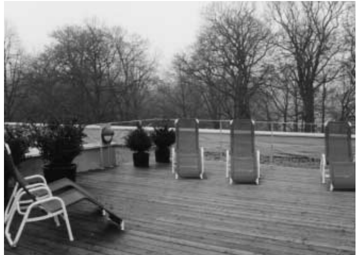
Blick über unsere Dachterrasse

Das Solarium von Ergoline entspricht den neuesten Erkenntnissen – und selbstverständlich erhalten Sie als zusätzliche Sicherheit eine Schutzbrille zur Schonung der empfindlichen Haut Ihrer Augen.