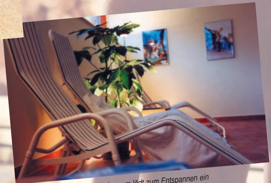
Unser Ruheraum lädt zum Entspannen ein