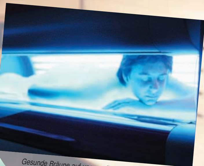
Gesunde Bräune auf unserer Ergoline Classic 450