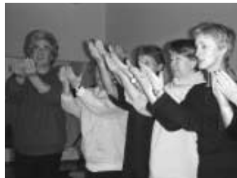
Wir aktivieren unsere Energie

gungsfolge zum Thema der fünf chinesischen Elemente. Hartwig regte an, diese Folge vielleicht in das laufende Qi Gong Training mit aufzunehmen.