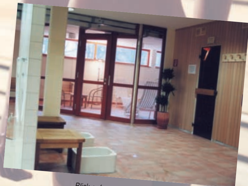
Blick auf unseren Ruheraum